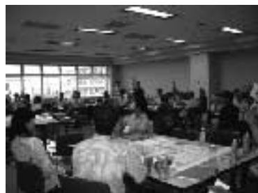
旗揚げアンケートの様子